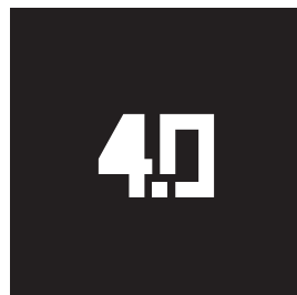
Símbolo Negativo monocromia